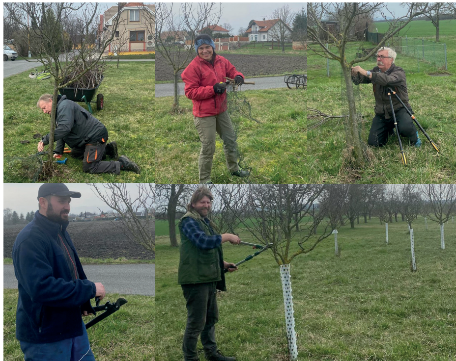
Fotky z brigády Koutecké lípy, z.s.

30.4. – Májka a čarodějnice se budou konat na naší návsi. Začátek setkání je v 16 hodin. Informační plakáty opět vyvěsíme závčas na obvyklá místa v obci.