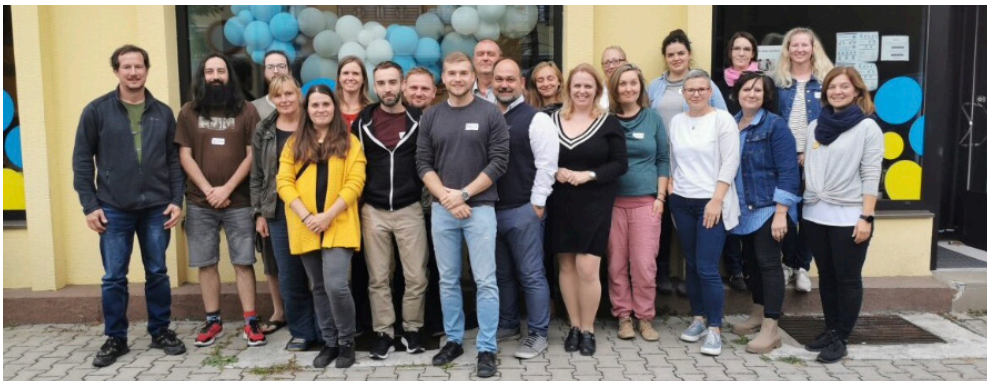
Na setkání do Pardubic přijeli zástupci ze všech koutů České republiky.