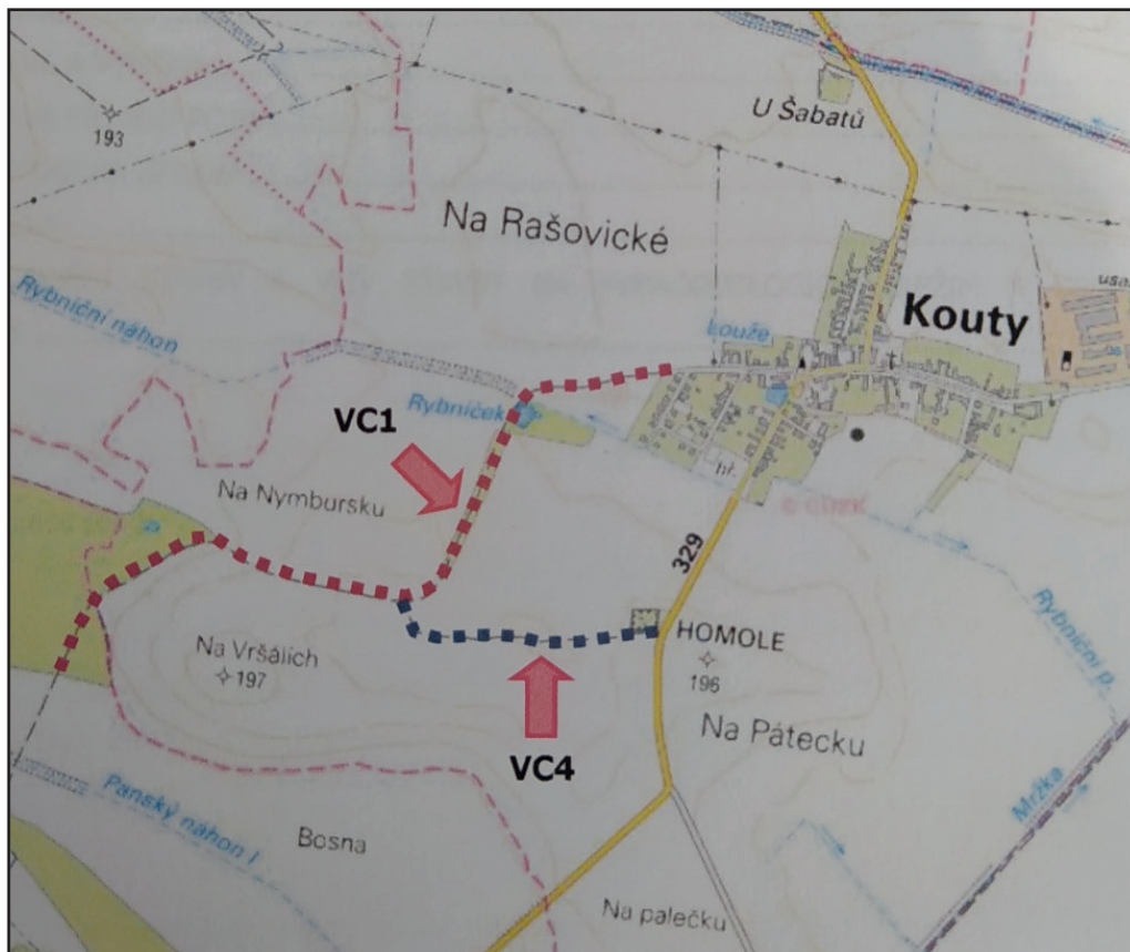
Mapa nově budovaných polních cest v katastru obce Kouty

Novinky z obce sledujte též na našich sociálních sítích